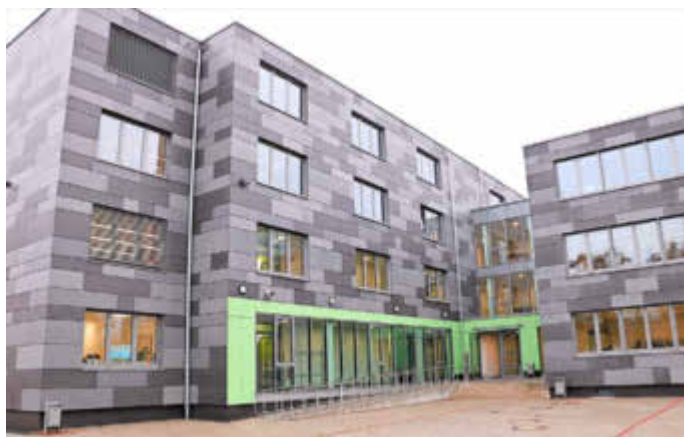
Die Schule ist auch von außen ein optischer Hingucker.