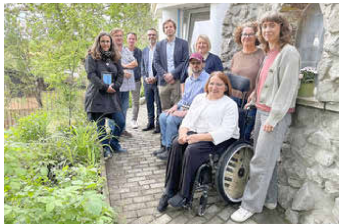
Abschluss der Tour in Holzweißig beim Projekt „Inklusiver Zukunftsgarten für Groß und Klein“ des Klippel-Feil-Syndrom e.V.

Skizze bis zum tragfähigen Konzept begleitet und neue Projekte für die Region angestoßen. Im Zuge des Projektes wurde eine Online-Beteiligungsplattform geschaffen. Den Abschluss der Tour bildete der Besuch des Projekts „Inklusiver Zukunftsgarten für Groß und Klein“ in Holzweißig des Klippel-Feil-Syndrom e.V.