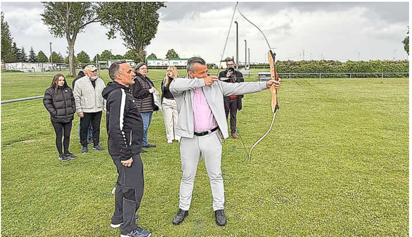
Andy Grabner zu Gast beim Bogensport Großzöberitz e.V. - im Gepäck hatte der Landrat einen Spendenscheck für die Kinder- und Jugendarbeit des Vereins.

Informations- und Amtsblatt des Landkreises Anhalt-Bitterfeld