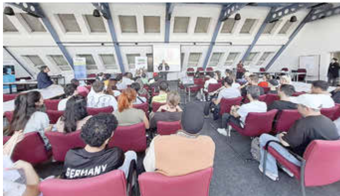
Die Ausbildungskampagne 2025 im Kreistagssitzungssaal Köthen stieß auf großes Interesse.

Das Ministerium für Arbeit, Soziales, Gesundheit und Gleichstellung Sachsen-Anhalt lädt gemeinsam mit starken Partnerinnen und Partnern zu einer zentralen Informationsveranstaltung im Rahmen der Ausbildungskampagne Migration 2026 ein. Ziel ist es, jungen Menschen mit Migrationsgeschichte einen verständlichen und praxisnahen Einblick in das deutsche Ausbildungssystem zu geben.