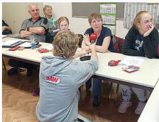
Volle Konzentration beim Übersetzen eines englischen Popsongs ins Deutsche.

um sich über das aktuelle Kursangebot zu informieren und selbst Teil dieser lebendigen Lernkultur zu werden.