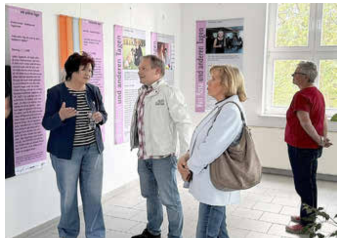
Wandeln und schauen - die Ausstellung in der Landkreisverwaltung Köthen ist noch bis Mitte Juni zu sehen.

Die Ausstellung „Von Rosa und anderen Tagen“ ist noch bis Mitte Juni zu den Öffnungszeiten der Landkreisverwaltung Anhalt-Bitterfeld, am Flugplatz 1 Köthen zu sehen. Sie bietet Besuchern die Chance, Vertrautes zu finden und Neues zu entdecken – in den subjektiven Selbstzeugnissen von Frauen aus unterschiedlichsten Kulturkreisen. Ein Plädoyer für Empowerment, das auch nach fast zwei Jahrzehnten nicht veraltet ist.