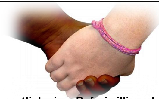
Ehrenamtliche in z.B. freiwilligen Initiativen