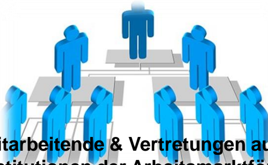
Mitarbeitende & Vertretungen aus Regelinstitutionen der Arbeitsmarktförderung