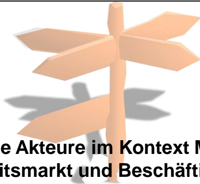
Regionale Akteure im Kontext Migration, Arbeitsmarkt und Beschäftigung