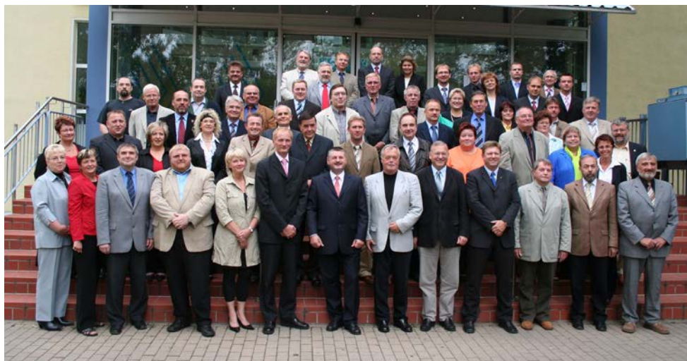
Die Mitglieder des Kreistages Anhalt-Bitterfeld zur konstituierenden Sitzung am 12.07.2007

Der Kreistag Anhalt-Bitterfeld besteht aus 54 Mitgliedern, die ehrenamtlich tätig sind, und dem Landrat, der ebenso Stimmrecht hat.