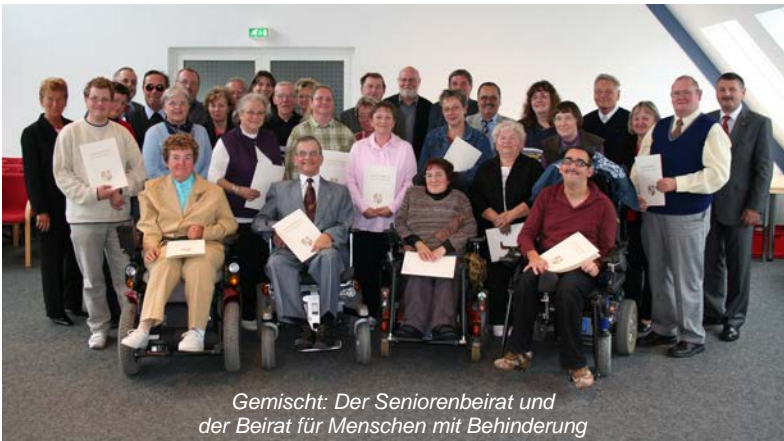
Gemischt: Der Seniorenbeirat und der Beirat für Menschen mit Behinderung