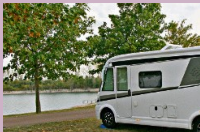
Caravan & Camping im Seebad Edderitz