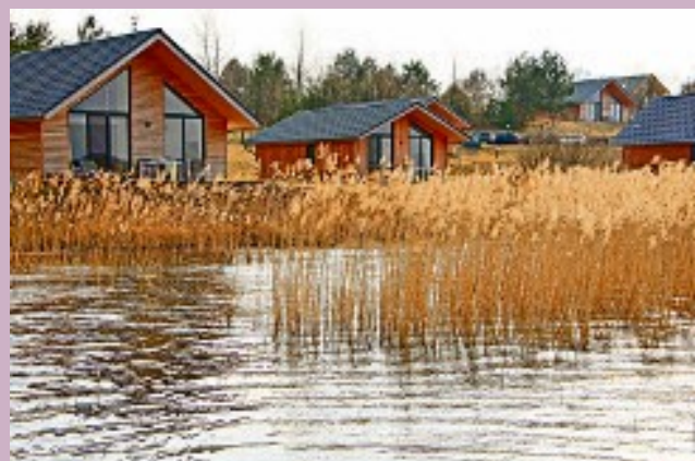
See- und Waldresort Gröbern

Unterkünfte, das See- und Waldresort in Gröbern, ein besonderes Baumhaus und ein Hügelhaus in Altjeßnitz genannt. Sehr attraktiv sind zudem auch die Caravan-Stellplätze im Seebad Edderitz.