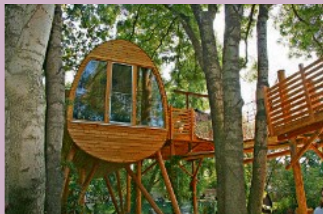
Baumhaus in Altjeßnitz