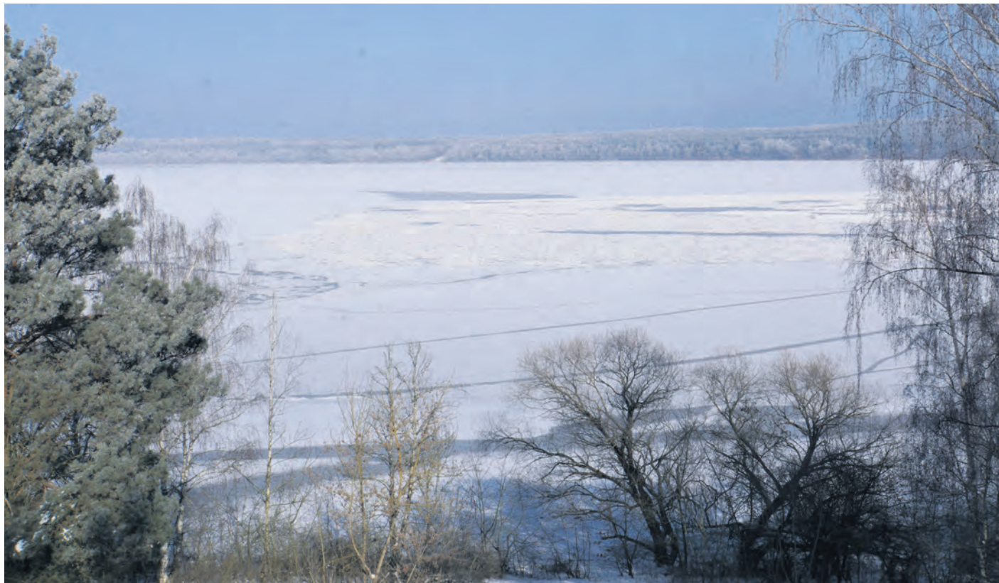
Der Muldestausee im Winter.

Ab 11 Uhr laden wir kleine und große Naturfreunde zu einer Winterwanderung mit Spurensuche am Muldestausee ein. Damit uns möglichst nichts entgeht, stehen Ferngläser für Kinder und Erwachsene bereit und begleiten werden uns ausgebildete Jagdhunde. Anschließend stellen die Jäger ihre Hunde und deren Aufgaben bei der Jagd vor. Wenn es die Witterung zulässt, wird ein Falkner die Fähigkeiten seiner Tiere demonstrieren. In der Ausstellung des Umweltbildungszentrums erfahren die Besucher in der Zeit bis 17 Uhr Interessan-