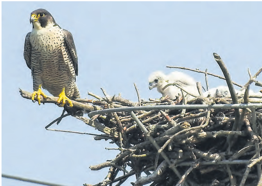
Wanderfalkenweibchen mit drei Küken.