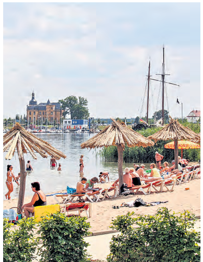
Das Wasser am Badestrand "Am Pegelturm" an der Goitzsche besitzt ausgezeichnete Badequalität.

Empfohlen wird, zum Baden in natürlichen Gewässern allein die ausgewiesenen Badestellen zu nutzen. Andere Gewässer wie beispielsweise Kiesseen, Baggerlöcher oder kleinere Teiche werden nicht regelmäßig überwacht.