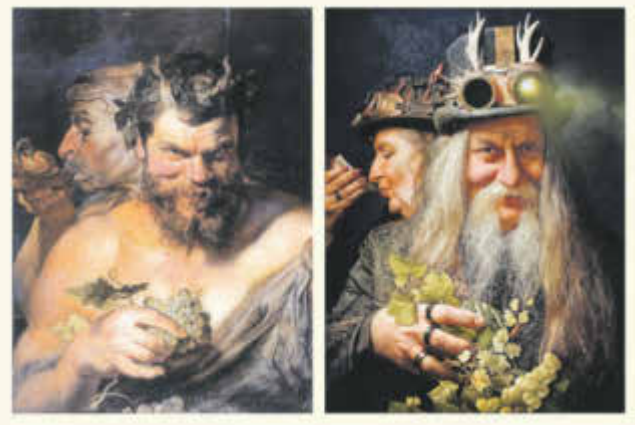
Original links, Peter Paul Rubens, Zwei Satyrn, 1619

Verschiedene Fotografen des Steampunks haben berühmte Gemälde, etwa von Leonardo da Vinci, im Foto nachgestellt – und zwar im Steampunk, so, wie es in dieser Kulturströmung üblich ist, in einer Ästhetik, die das viktorianische Zeitalter mit futuristischer Technik verknüpft: Science-Fiction im Schnürkorsett.