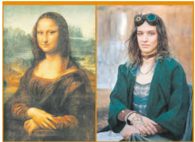
Original links, Leonardo da Vinci, Mona Lisa, 1503

Die spektakuläre Ausstellung ist noch bis zum 16. Juli 2023, jeweils samstags und sonntags von 13 bis 17 Uhr im Dürerbundhaus in der Theaterstraße 12 in Köthen zu sehen.