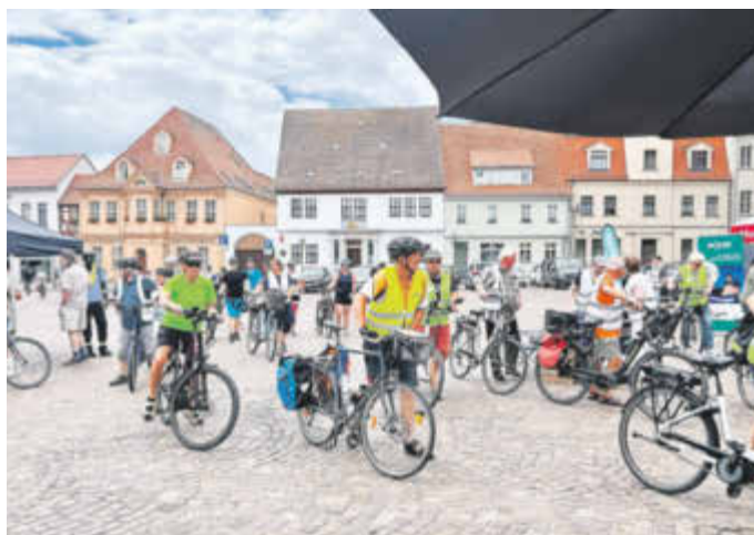
Ankunft am Ziel auf dem Köthener Marktplatz