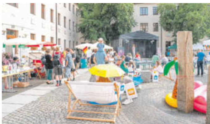
Im Innenhof der Leucorea Wittenberg herrschte ein reges Treiben.