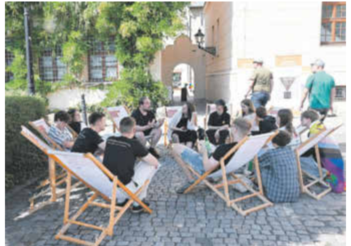
Austausch der Jugendforen des Landkreises Anhalt-Bitterfeld

Die Partnerschaft für Demokratie „KREIS DER VIELFALT! Anhalt-Bitterfeld“ wird durch das Bundesprogramm „Demokratie leben!“ des Bundesministeriums für Familie, Senioren, Frauen und Jugend und des Ministeriums für Arbeit, Soziales, Gesundheit und Gleichstellung des Landes Sachsen-Anhalt im Rahmen des Landesprogramms für „Demokratie, Vielfalt und Weltoffenheit in Sachsen-Anhalt“ gefördert.