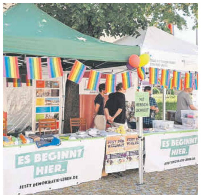
Infostand der Partnerschaften für Demokratie der Region