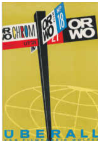
ORWO-Werbeplakat von 1965

Von dem Motiv wird dann der Blick auf die Film-Marke ORWO gelenkt, womit die Werbe-Botschaft transportiert ist. Es gab verschiedene Größen von ORWO-Plakaten. Die kleinsten Motive wurden in DIN A3 angefertigt, doch die meisten sind in den Größen 50 x 60 cm bis 60 x 80 cm angelegt. Die Reklameplakate erzählen uns heute nicht nur von der professionellen Arbeit der ORWO-Werbeabteilung. Beim genauen Hinschauen lassen sich auch im Laufe der Zeit erfolgte Veränderungen in Mode und Stil verfolgen.