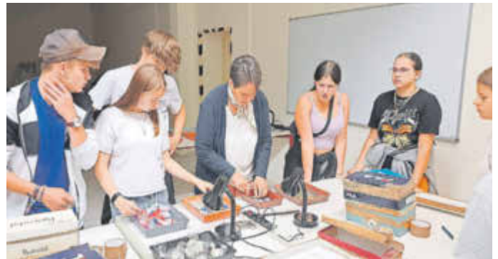
Besucher der Jugendtreffs probieren sich in experimenteller Fotografie.

Neben den öffentlichen Aktionen für jedermann realisierte das Team um Museumspädagogin Nicola Hedemann auf Anfrage spezielle Besucherwünsche. Unter anderem war kurz entschlossen der Hort aus Jeßnitz mit 33 Kindern im IFM. Nach einer altersspezifischen Führung wagten die kleinen Gäste das Fotografieren mit dem Schuhkarton (Lochkamera). Ebenso zu Besuch waren der „Kinder- und Jugendfreizeit-treff Greppin“ sowie der „Krondorfer Jugendtreff“, die ebenfalls Fotos mit der Lochkamera aufnahmen, um sie dann im Dunkeln des museumspädagogischen Labors zu entwickeln.