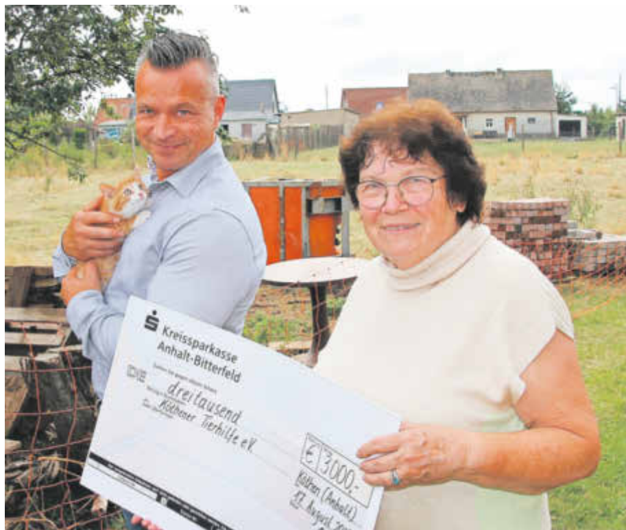
Dagobert aus Dohndorf hat es sich gemütlich gemacht im Arm des Landrates. Auch er sucht ein neues Zuhause.