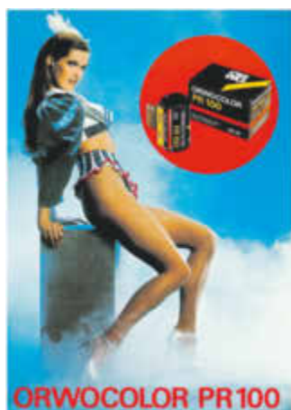
Werbeplakat ORWOCOLOR PR100

Aufmerksamkeit und möglichst Kaufinteresse zu erwecken. Erfahrungsgemäß lassen sich Menschen besonders von Motiven ansprechen, die sie gern fotografieren oder zumindest gern fotografieren würden. Das sind zum Beispiel niedliche kleine Kinder, kuschelige Tiere, hübsche Frauen, schöne Blumen, ausgewählte Sehenswürdigkeiten oder besondere Landschaften.