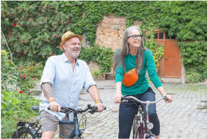
Machen Sie mit beim STADTRADELN vom 24. August bis 13. September.

Liebe Radlerinnen und Radler, vom 24. August bis zum 13. September 2025 nimmt der Landkreis Anhalt-Bitterfeld zum zweiten Mal am STADTRADELN teil. Während dieses 21-tägigen Zeitraums sollen möglichst viele Wege mit dem Rad zurückgelegt werden, um Kilometer für Ihr Team, Ihre Kommune und für mehr Radförderung zu sammeln.