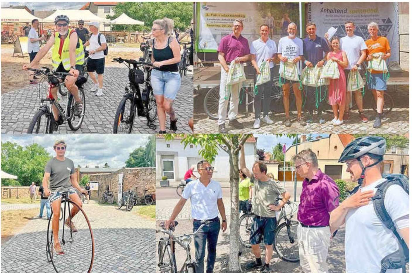
Impressionen vom 3. Fahrradaktionstag des Landkreises Anhalt-Bitterfeld in Zörbig.

Informations- und Amtsblatt des Landkreises Anhalt-Bitterfeld