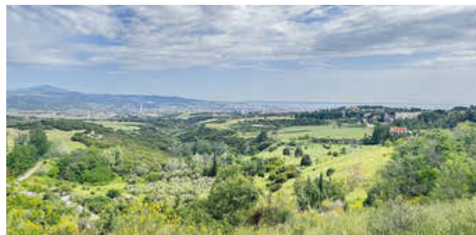
Der Blick zum benachbarten Thessaloniki.

Die offene und freundliche Art der Bewohner trug maßgeblich zu einem positiven Aufenthalt bei. Nicht nur das menschliche Miteinander, sondern auch die Umgebung, wie der malerische Oreokastro Lake, boten den Auszubildenden Gelegenheit zur Erholung. Obwohl der See nicht sehr groß ist, stellt er dennoch einen Ort der Entspannung dar.