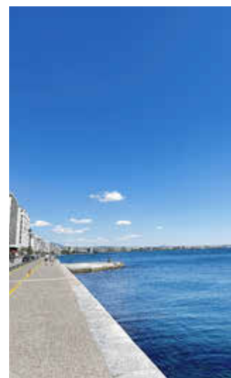
Die Promenade von Thessaloniki.

Zusammenfassend war der Austausch in Oreokastro für unsere Auszubildenden eine wertvolle Erfahrung, die sowohl ihre beruflichen als auch ihre persönlichen Horizonte erweitern konnte.