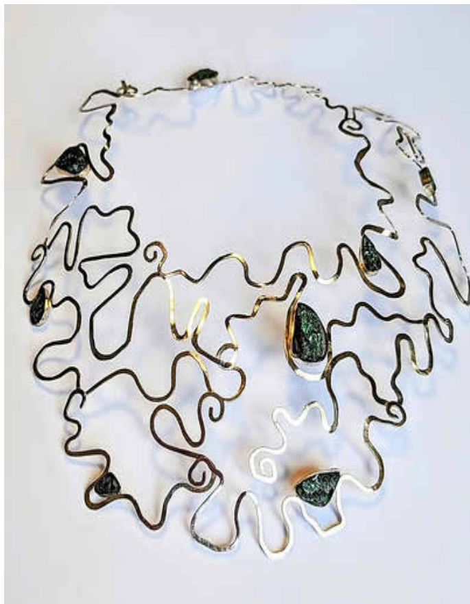
„Collier Atlantis“, von Silke Lipsch

Am 3. September 2025 wird Silke Lipsch ab 18 Uhr in der Musik-Galerie die „Kunst der Schmuckgestaltung“ vorstellen. Sie ist eine der Halleschen Künstler und Künstlerinnen, die in der Galerie seit Mai Ihre Arbeiten präsentieren. Ihre fantasievollen Kreationen zum Thema Tiefseewesen haben unsere Besucher – und naturgemäß vor allem unsere Besucherinnen – fasziniert. So manche hat sich gefragt, wie solche schönen Schmuckstücke entstehen.