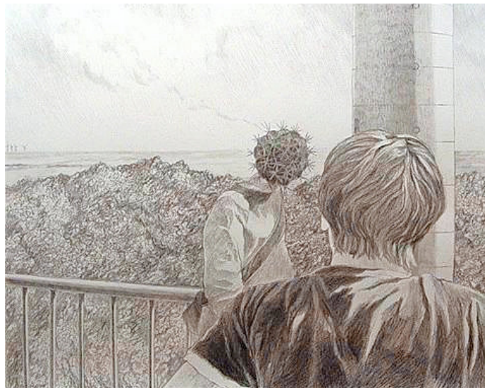
„Begegnung“, von Danilo Pockrandt

Finissage zur Ausstellung „Wesenheiten. Grafik, Malerei und Schmuckgestaltung“ von Danilo Pockrandt, Franz Gabriel Walther und Silke Lipsch