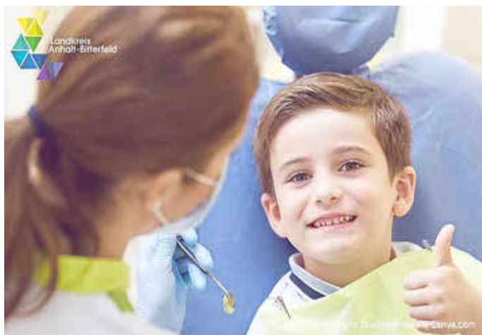
Die Zahngesundheit der Kinder im Alter von 3 bis 6 verbessert sich stetig.

Eine besonders gute Nachricht: Die Zahngesundheit der Kinder im Alter von 3 bis 6 verbessert sich stetig. Während im Jahr 2015 nur 69 Prozent dieser Altersgruppe naturgesunde Zähne vorweisen konnten, kam es bis 2025 zu einer deutlichen Steigerung auf 75 Prozent. Ebenso zeigt sich ein positiver Trend bei den 6- bis 7-jährigen Erstklässlern. Im Jahr 2025 haben 10 Prozent mehr Kinder gesunde Zähne als noch 2015. Dies ist eine positive Entwicklung, die einerseits auf ein gutes Prophylaxe-Angebot, aber ebenso auf ein gestiegenes Gesundheitsbewusstsein vieler Eltern zurückzuführen ist.