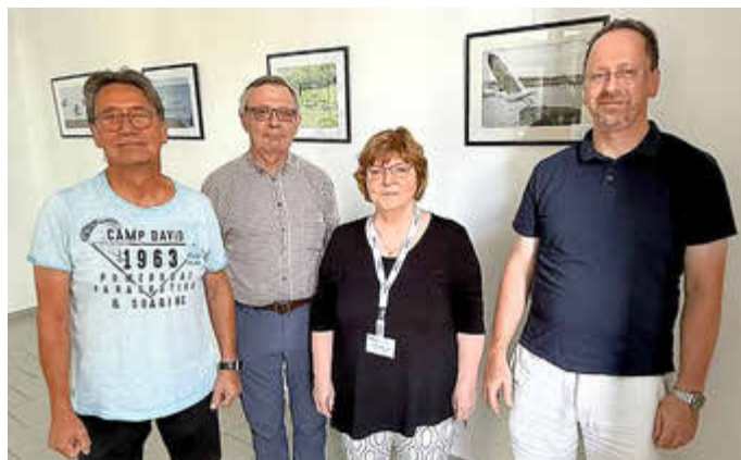
Die Mitglieder des Fotokurs präsentieren ihren fotografischen Jahresrückblick.

Übrigens: Der Fotokurs der KVHS Anhalt-Bitterfeld findet jeden zweiten Samstag im Monat statt, neue Interessenten sind herzlich willkommen.