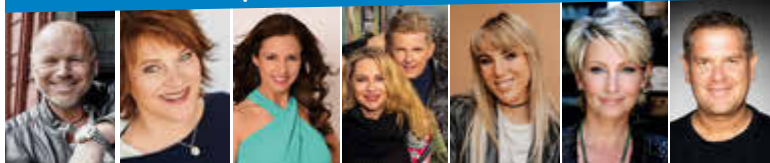
Olaf Henning, Nicki, Anita Hofmann, Markus & Yvonne, Annemarie Eilfeld, Claudia Jung und Peter Wackel

Weitere Infos unter: www.schlager-kanaren.de