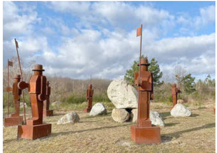
Wächter der Goitzsche.

Die Teilnahme ist kostenlos. Die Teilnehmerzahl ist beschränkt, um vorherige Anmeldung wird gebeten. Die Teilnahme an der Fahrradtour erfolgt in eigener Verantwortung. Jeder nimmt auf eigene Gefahr teil und haftet für sich selbst.