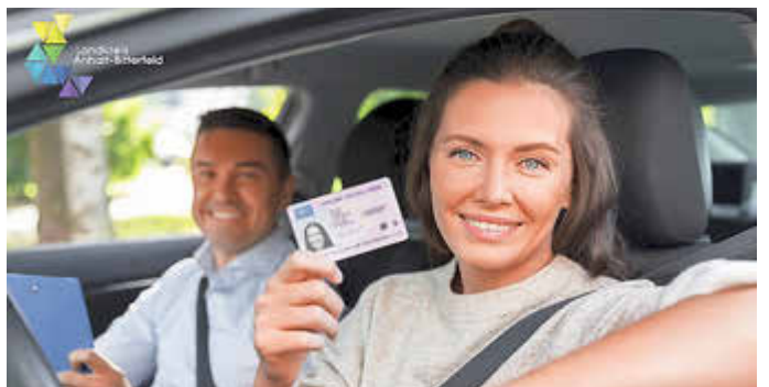
Alle Führerscheine, die vor dem 19. Januar 2013 ausgestellt wurden, müssen bis spätestens 19. Januar 2033 umgetauscht werden.

Unsere Fahrerlaubnisbehörde hilft Ihnen gern weiter. Termine können bequem online über die Internetseite des Landkreises unter https://www.anhalt-bitterfeld.de/de/fuehrerschein.html vereinbart werden – schnell und ohne Wartezeiten. Außerdem erreichen Sie uns per E-Mail unter feb@anhalt-bitterfeld.de sowie während der Öffnungszeiten auch telefonisch unter der zentralen Nummer 03496-601809.