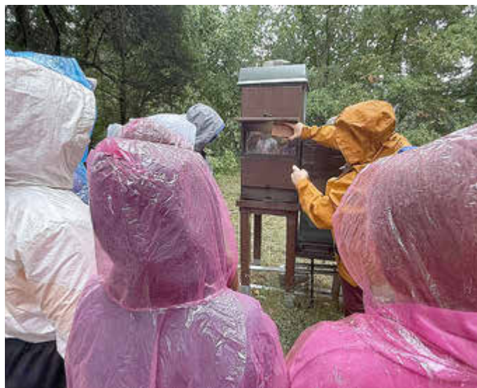
Blick in den Bienenstock - in dem ist bei regnerischem Wetter richtig viel los.

Ein Besuch im Haus am See lohnt sich aber auch für Familien und andere Naturinteressierte. Informationen zu Öffnungszeiten und Veranstaltungen finden Sie unter www.informationszentrum-hausamsee-schlaitz.de/ .