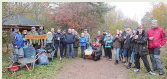
Bei vergangenen Aktionen haben viele Bürgerinnen und Bürger gemeinsam Müll gesammelt.

Landkreis bittet darum, dass Bürgerinnen und Bürger möglichst mit dem Fahrrad kommen und wenn vorhanden Handschuhe, Müllsäcke und Müllgreifer mitbringen. Materialien werden auch vor Ort bereitgestellt. Snacks und Getränke stehen für alle Helferinnen und Helfer bereit.