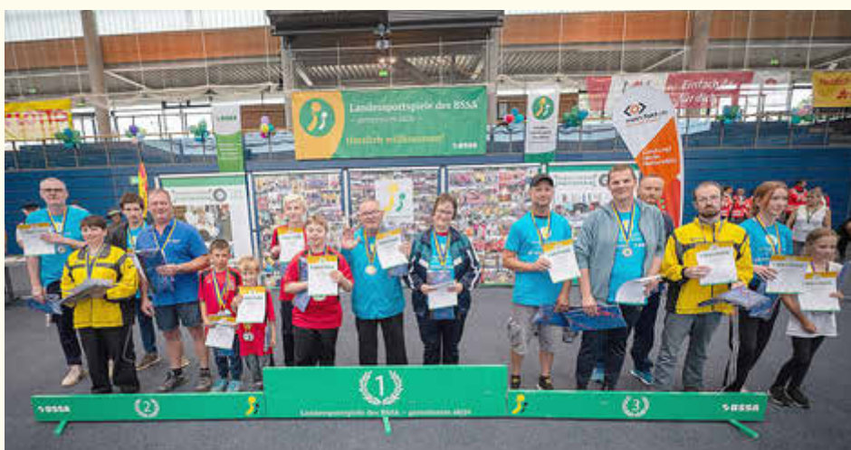
Siegerehrung für die Aktiven aus dem Landkreis Anhalt-Bitterfeld.

Am 23. August erlebten 1.002 Aktive in Weißenfels die 34. Landessportspiele des BSSA, unter ihnen auch Starterinnen und Starter aus dem Landkreis Anhalt-Bitterfeld. Sie erkämpften insgesamt sieben Medaillen, einmal Gold sowie je dreimal Silber und Bronze. Damit landeten sie auf Platz vier der erfolgreichsten Landkreise in diesem Jahr. Die Aktiven bewiesen an vier Wertungsstationen Geschicklichkeit, Tempo, Treffsicherheit und Teamgeist, auch Glück spielte eine Rolle. In Anlehnung an Geschichte und Tradition der Region hießen die Wettbewerbe Saale-Entenpaddeln, Weißenfelser Glückswürfeln, Farben-Puzzle und Schusters Zielwurf. Sportlerinnen und Sportler der Lebenshilfe Köthen und des Diakonievereins Bitterfeld-Wolfen waren in den Altersklassen II und II an der Wertungsstation Saale-Entenpaddeln besonders erfolgreich.