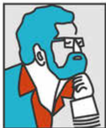
Konrad Wolf 100