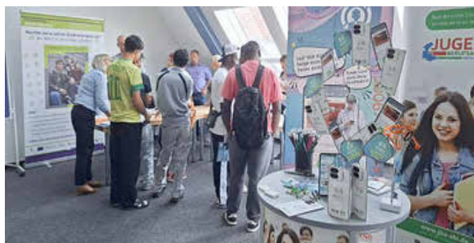
Eine Initiative des Ministeriums für Arbeit, Soziales, Gesundheit & Gleichstellung Sachsen-Anhalt mit starken PartnerInnen:

Die positive Resonanz zeigt: Viele der anwesenden Jugendlichen sehen eine Ausbildung nun als realistische und lohnende Option für ihre Zukunft. Damit wurde ein wichtiger Impuls gesetzt – für gelungene Integration und eine nachhaltige Fachkräftesicherung im Landkreis Anhalt-Bitterfeld.