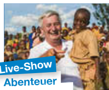
Live-Show Abenteuer Weltumrundung